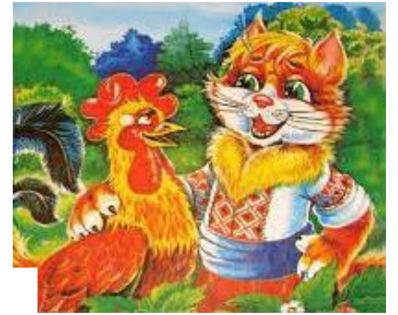
«Котик і Півник»