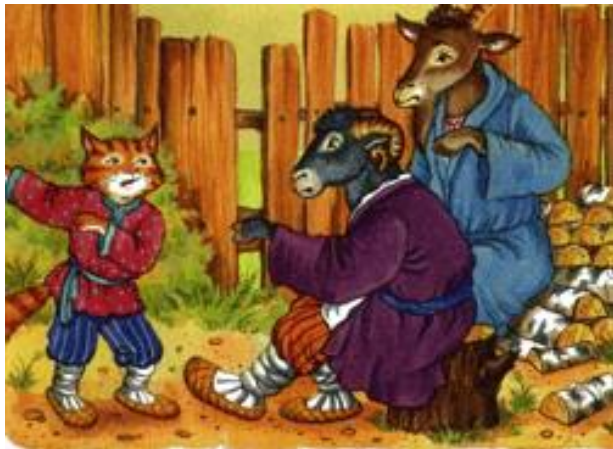
«Кіт, цап і баран»