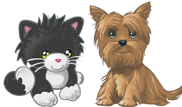
«Мурко і Бурко»