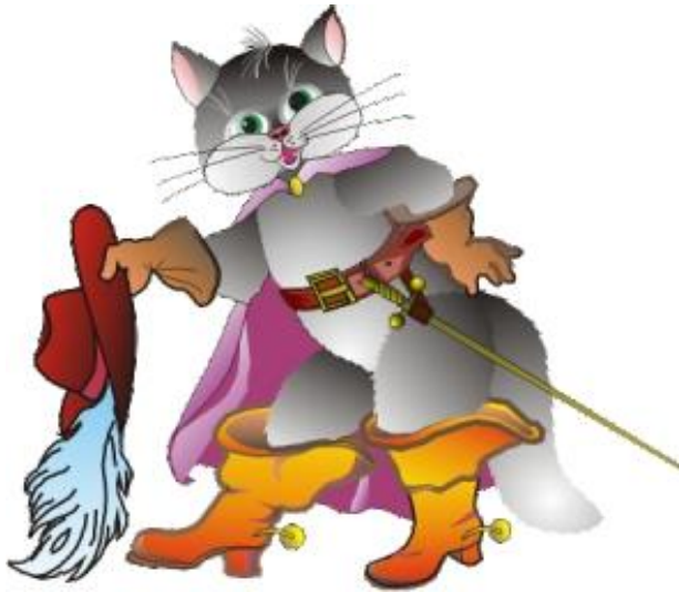
«Кіт у чоботях»

Які інші твори з такими ж героями ти знаєш?