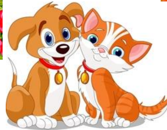
«Кіт і пес»