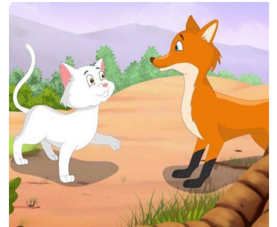
«Лис і кіт»