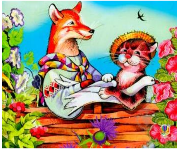
«Лисиця й кіт»